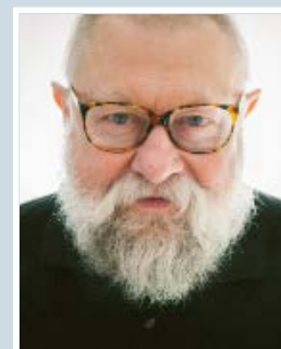
Prof. dr hab. Jerzy Bralczyk Przewodniczący Rady Programowej Europejskiego Forum Prawa i Edukacji

Warszawa, Pałac Staszica, ul. Nowy Świat 72.